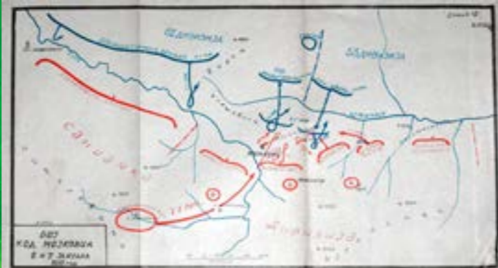
Zbirka fotografija Muzej Kralja Nikole - Narodni muzej Crne Gore

Na ovom mjestu došlo je do odlučujućeg okršaja između crnogorske i austrougarske vojske u čuvenoj Mojkovačkoj bici. Baš tu, na Božić 1916. godine, u jeku Prvog svjetskog rata, na Bojnoj Njivi našle su se dvije armije, jedna prema drugoj, na položajima jedva udaljenim 150 do 200 metara.